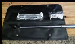
ラチェット工具付

掘削機のアタッチメント交換には 煩わしいピン抜き等の作業が無く、 作業の軽減と作業時間の 短縮が図れます