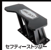
セフティーストッパー

切断力が上がり、幹径が従来より350mmと大きくなります。又、集積・積み込みグリップとして、刃が邪魔になることなく使用することが可能になります。