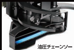
油圧チェーンソー